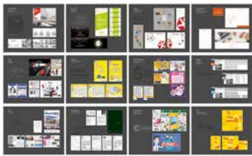
BOOK 2012-2013, 2014-2015, 2016-2017, 2018-2019, 2020-2021, 2022-2023, 2024-2025